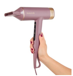
In Hand 3