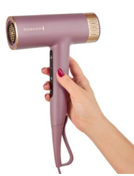
In Hand 1