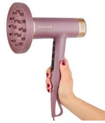
In Hand 2