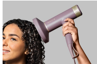
In Use 1