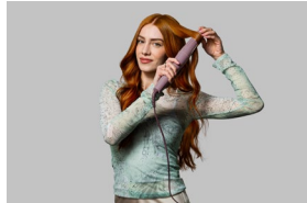
In Use 1