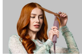
In Use 2