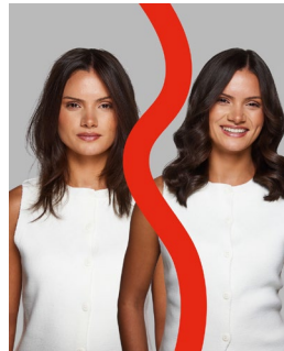
Vorher & Nachher