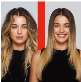
Vorher & Nachher