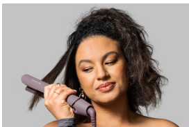
In Use 1