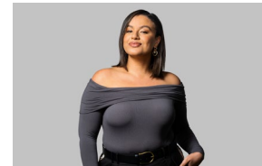
End Look 2