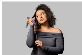
In Use 2